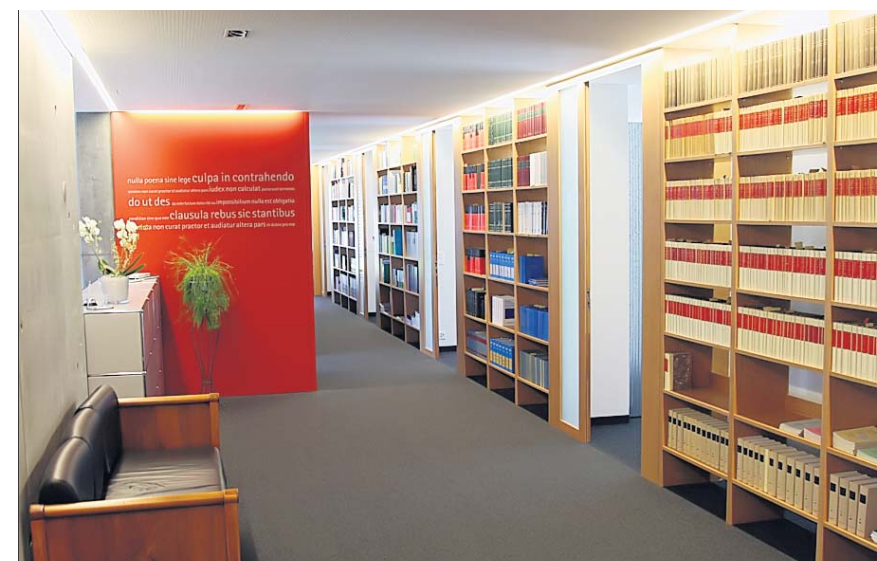
Rechtsberatung in angenehmer Atmosphäre.