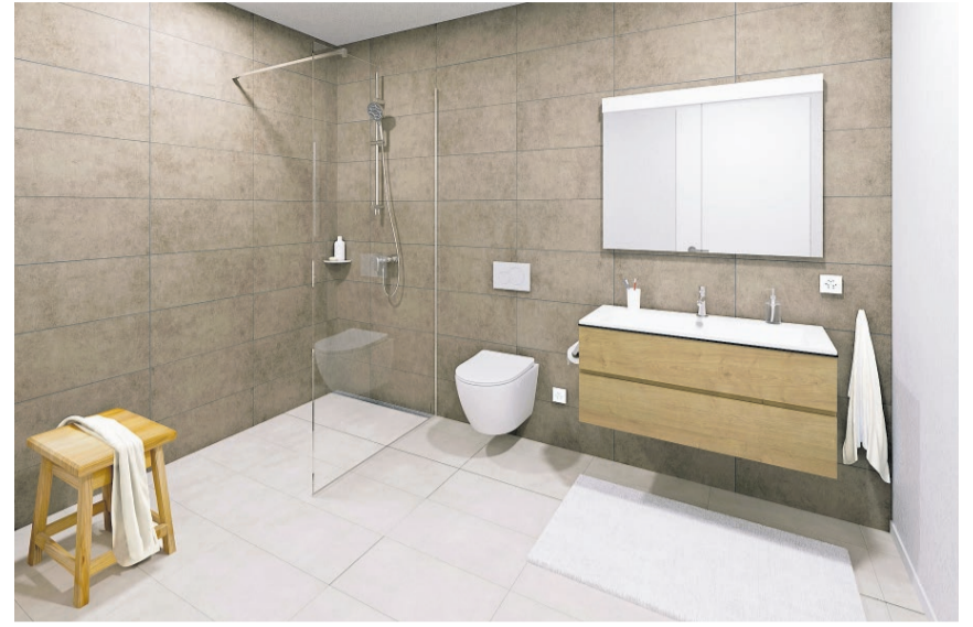
Das stilvolle Badezimmer überzeugt mit hochwertigen Armaturen und einer modernen, begehbaren Dusche.

Erstvermietung und Bewirtschaftung: Die Immobilien-Treuhänder Straub & Partner AG Tel. 062 875 22 20 vermarktung@straub-partner.ch