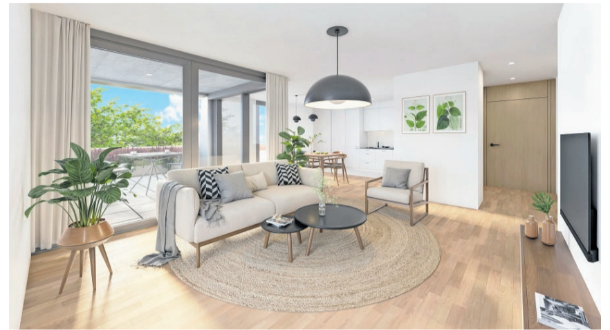
Der helle, grosszügig gestaltete Wohn- und Essbereich mit integrierter Küche lädt zum Verweilen und Geniessen ein.

IMPRESSUM: Sonderseiten des «Lenzburger Bezirks-Anzeigers» und «Der Seetaler / Der Lindenberg» Verlag: CH Regionalmedien AG, Verlagsredaktion, Neumattstrasse 1, 5001 Aarau Werbemarkt: Aargauer Zeitung, Neumattstrasse 1, 5000 Aarau, Tel. 058 200 53 53, inserate@chmedia.ch