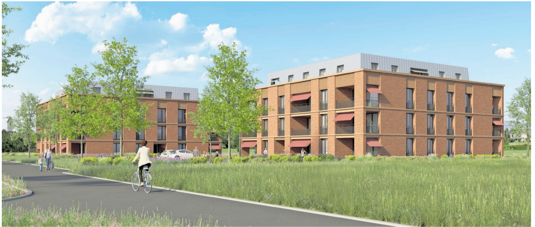
Die beiden dreistöckigen Gebäude mit 41 Alterswohnungen liegen zentral mit Blick ins Grüne.

Die Nachfrage ist bereits jetzt hoch, erste Einheiten sind schon reserviert. Interessierte sollten daher nicht zu lan-